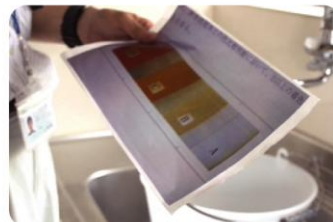
水回りの錆、作動状況をチェック。