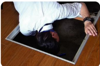
目の届きにくい場所もチェック

戸建てで最大17項目97箇所、見えないところまで細かく建築士がチェック。「被災しやすい災害」に備えるためにも、一度プロの目で点検しませんか？